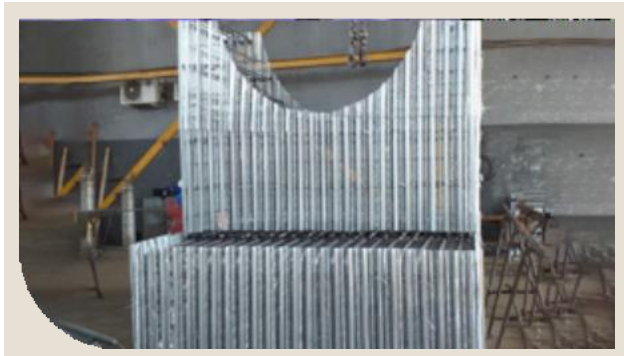
Figura 5 - Blocos com APS e Fôrma Incorporada

A ArcelorMittal também fornece as soluções APS e Fôrma Incorporada combinadas. Assim, a obra recebe peças com armação e fôrmas prontas para serem posicionadas e concretadas.