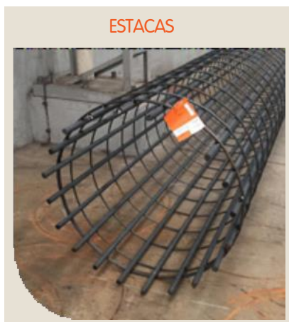
Figura 1 - Armadura Pronta Soldada

Garantia de produto sustentável, com Rótulo ecológico ABNT e Declaração ambiental de Produto (DAP - Tipo 3), o que ajuda a viabilizar a obtenção de certificação Lead.