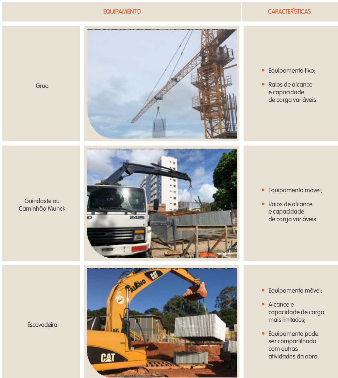
Tabela 1- Equipamentos para movimentação dos componentes de APS

Existem diferentes possibilidades de se movimentar as peças de APS com ou sem Fôrma Incorporada na obra, conforme apresentado na tabela a seguir.