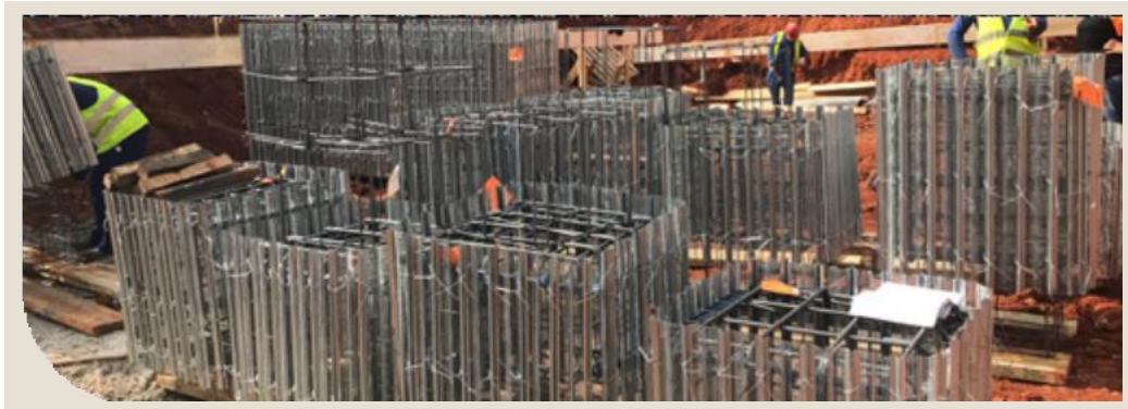
Figura 8 - Exemplo de blocos estocados no canteiro